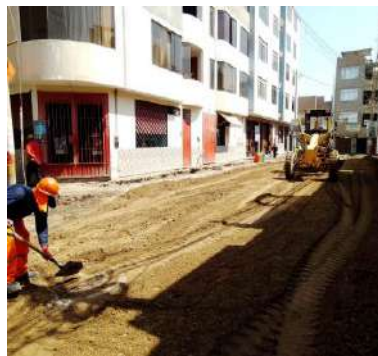
CREACION DE LA INFRAESTRUCTURA DE MOVILIDAD URBANA DEL PROGRAMA DE VIVIENDA VALLE HERMOSO I CALLAO DEL DISTRITO DE CALLAO- PROVINCIA Servicio de densidad