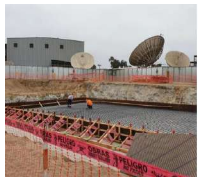
AMPLIACIÓN, REMODELACIÓN Y DEMOLICIÓN PARCIAL DE LOCAL DE VENTAS AL POR MAYOR Y ALMACEN DE INSUMOS INDUSTRIALES CONSTITUCIONAL DEL CALLAO – DEPARTAMENTO DE CALLAO Servicio de rotura de probetas