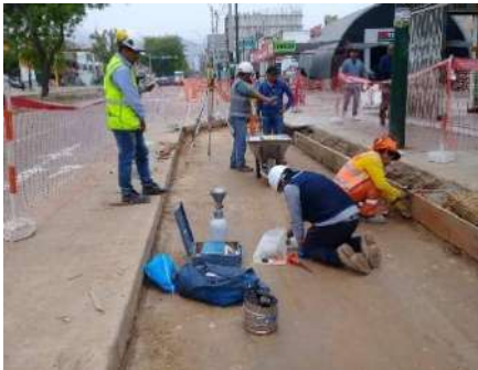
OBRA AV. BENAVIDES - PRUEBAS DE COMPACTACIÓN EN CAMPO Servicio de densidad