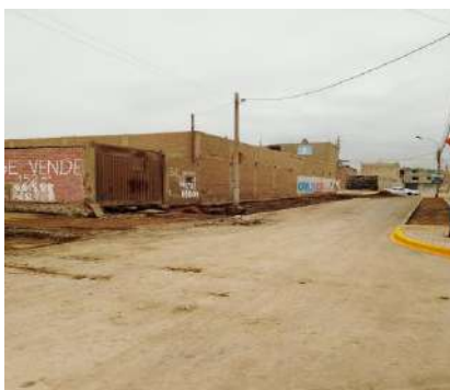
CREACIÓN DE LA INFRAESTRUCTURA VIAL URBANA EN EL PROGRAMA DE VIVIENDA ACUARIO DE OQUENDO DISTRITO CALLAO, PROVINCIA CALLAO, DEPARTAMENTO CALLAO Servicio de densidad