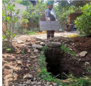
VIVIENDA MULTIFAMILIAR R-18, ATE Servicio de Estudio de Mecánica de Suelos