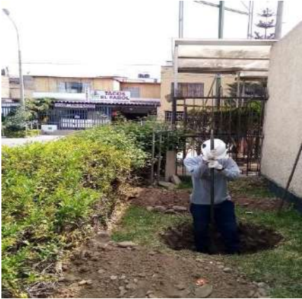
VIVIENDA MULTIFAMILIAR - SALAMANCA Servicio de Estudio de Mecánica de Suelos