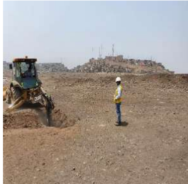
VIVIENDA COMERCIO – PUENTE PIEDRA Servicio de Estudio de Mecánica de Suelos