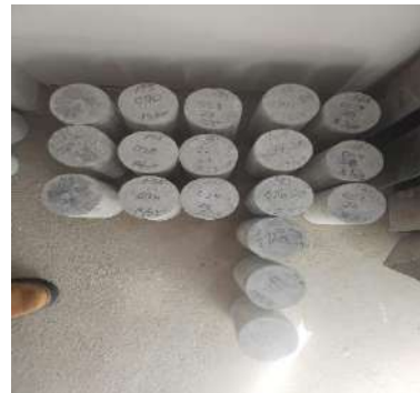
CREACIÓN DEL SERVICIO DE MOVILIDAD URBANA A TRAVES DE PISTAS Y VEREDAS EN EL AA.HH. LA PAZ DEL DISTRITO DE VENTANILLA - PROVINCIA CONSTITUCIONAL DEL CALLAO - DEPARTAMENTO DEL CALLAO Servicio de rotura de probetas