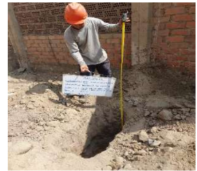
RESIDENCIAL LAS AMERICAS – SAN MARTIN DE PORRES Servicio de Estudio de Mecánica de Suelos