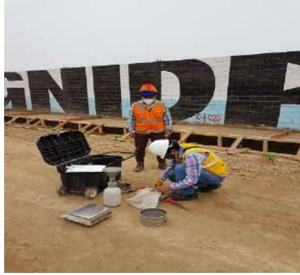
REPARACIÓN DE PISTA Y VEREDA EN EL (LA) CALLE BLAS BORZANI CDRA. 1, URB. LOS ROSALES DE SANTA ROSA, DISTRITO DE LA PERLA, PROVINCIA CALLAO, DEPARTAMENTO CALLAO Servicio de densidad