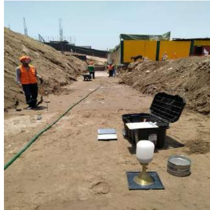
PRUEBAS DE COMPACTACIÓN – PROYECTO LURIN Servicio de densidad