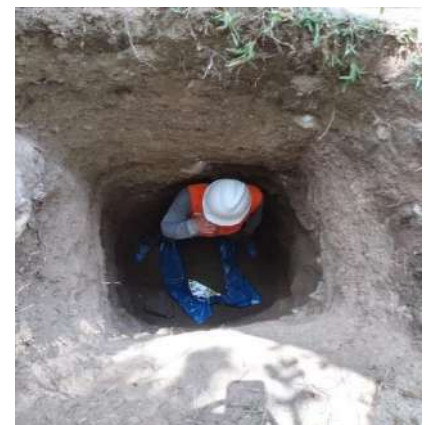
VIVIENDA MULTIFAMILIAR - CAÑETE Servicio de Estudio de Mecánica de Suelos