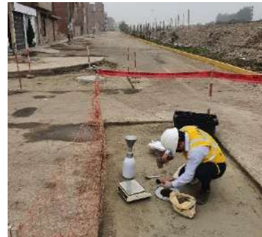
ESQUEMA CARAPONGO - AMPLIACION DE LOS SISTEMAS DE AGUA POTABLE Y ALCANTARILLADO DE LOS SECTORES 136 Y 137 DEL DISRITO DE LURIGANCHO Servicio de densidad