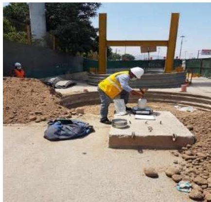
OBRA SEDAPAL - PRUEBAS DE COMPACTACIÓN EN CAMPO Servicio de densidad