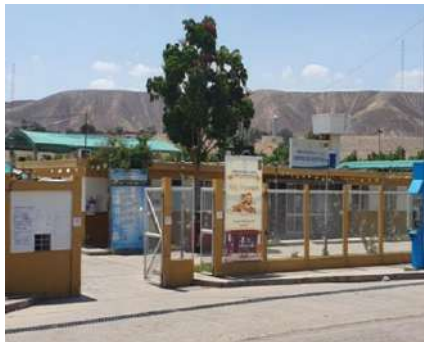
MEJORAMIENTO Y AMPLIACION SERVICIO DE SALUD DEL ESTABLECIMIENTO DE SALUD APOYO DE PALPA, DISTRITO DE PALPA - PROVINCIA DE PALPA - DEPARTAMENTO DE ICA Servicio de ensayos de suelo