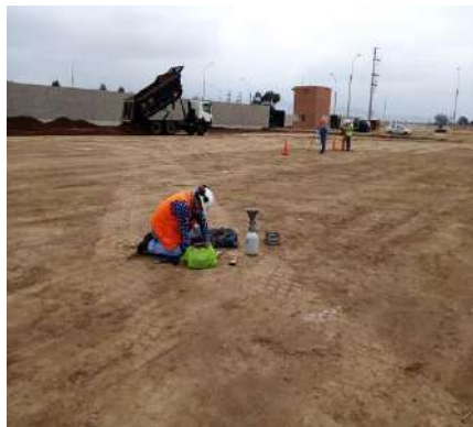
INDUPARK - PUCUSANA Servicio de densidad