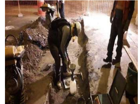
OBRA SURCO - PRUEBAS DE COMPACTACIÓN EN CAMPO Servicio de densidad