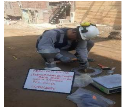
CONSTRUCCIÓN DE PISTAS Y VEREDAS EN EL AA.HH. VILLA EMILIA DISTRITO DE MI PERÚ - CALLAO - CALLAO SEGUNDA ETAPA Servicio de densidad