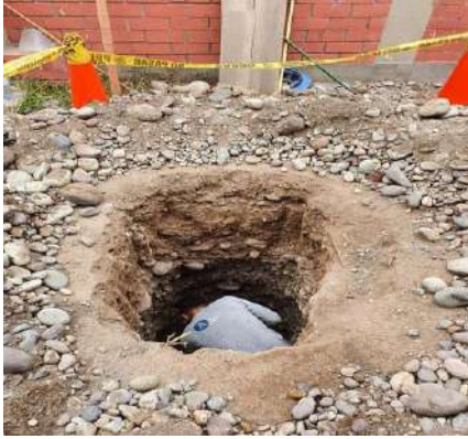
VIVIENDA MULTIFAMILIAR – DISTRITO DE SURCO Servicio de Estudio de Mecánica de Suelos