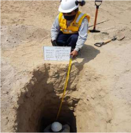
VIVIENDA UNIFAMILIAR OBRA EN ALAMEDA LIMA SUR - CHILCA Servicio de Estudio de Mecánica de Suelos