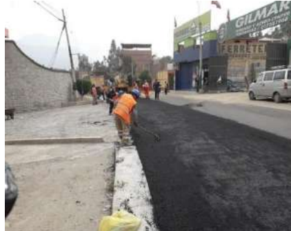
SUPERVISION ASFALTO EN CALIENTE