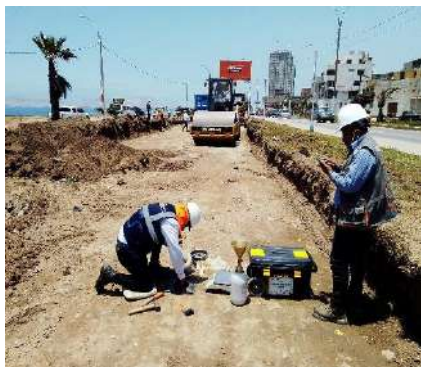
CREACIÓN DEL MIRADOR LA PERLA EN LA AV. COSTANERA CDRAS. 23, 24, 25, 26, 27, 28 - DISTRITO DE LA PERLA. PROVINCIA DE CALLAO - DEPARTAMENTO DE CALLAO Servicio de densidad