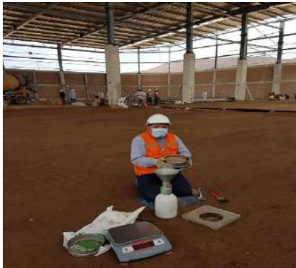
NAVE INDUSTRIAL EN CHILCA Servicio de densidad