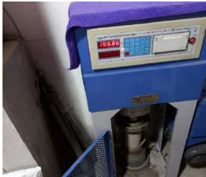
RESIDENCIAL VALDELOMAR – PUEBLO LIBRE Servicio de rotura de probetas