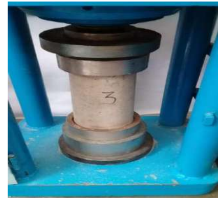
ENSAYOS DE RESISTENCIA A LA COMPRESIÓN EN CONCRETO - LURIN Servicio de Rotura de Probetas