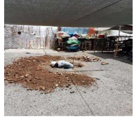
VIVIENDA MULTIFAMILIAR – DISTRITO DE BREÑA Servicio de Estudio de Mecánica de Suelos