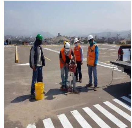
CONTROL DE CALIDAD CARPETA ASFÁLTICA – CHORRILLOS Servicio de Extracción de Diamantinas