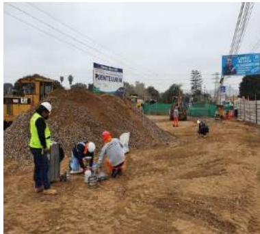
MEJORAMIENTO DE LA TRANSITABILIDAD VEHICULAR Y PEATONAL EN EL PUENTE LURIN CRUCE VIA ANTIGUA PANAMERICANA SUR CON LA CALLE LOS LAURELES DEL DISTRITO LURIN - PROVINCIA DE LIMA - DEPARTAMENTO DE LIMA Servicio de densidad