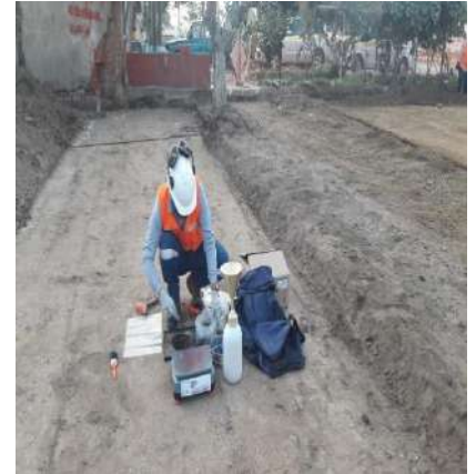
EXTERIOR OBRA TOTTUS PUENTE PIEDRA Servicio de densidad