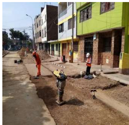
PRUEBAS DE COMPACTACIÓN – SANTA ANITA Servicio de densidad