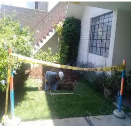
VIVIENDA MULTIFAMILIAR CANTO BELLO, AV. CANTO BELLO 357- 359 MZ B LT 13 URB. CANTO BELLO, DISTRITO DE SAN JUAN DE LURIGANCHO, LIMA, LIMA. Servicio de Estudio de Mecánica de Suelos