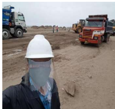
CICLOVIAS AV PACIFICO Servicio de densidad