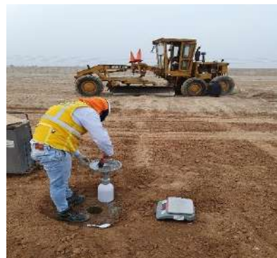
ESQUEMA CARAPONGO - AMPLIACION DE LOS SISTEMAS DE AGUA POTABLE Y ALCANTARILLADO DE LOS SECTORES 136 Y 137 DEL DISRITO DE LURIGANCHO Servicio de densidad