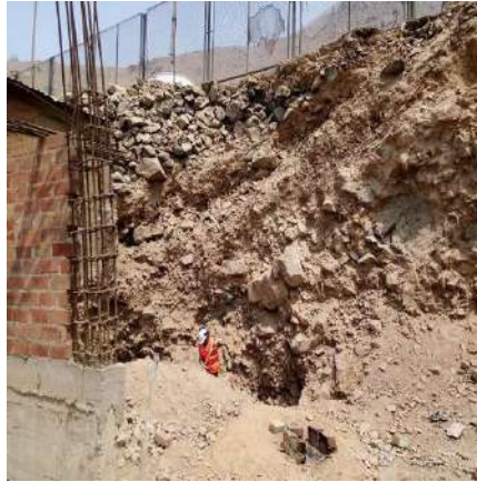
LOCAL COMERCIAL - CAJAMARQUILLA Servicio de Estudio de Mecánica de Suelos