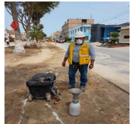
CICLOVIAS AV PACIFICO Servicio de densidad