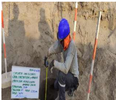
CONSTRUCCIÓN DE PISTAS Y VEREDAS EN EL AA.HH. VILLA ESCUADERO DISTRITO DE MI PERÚ - CALLAO – CALLAO Servicio de Estudio de Mecánica de Suelos